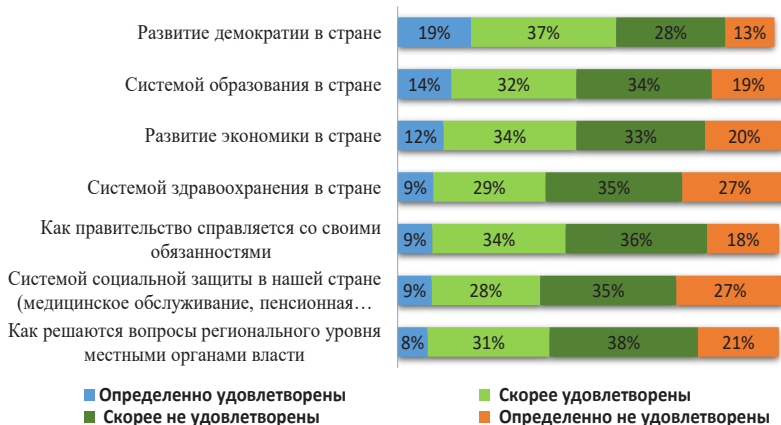
Рис. 1. Уровень удовлетворенности населения социально-политическими процессами в РК [7].

Согласно проведенному социологическому опросу в 2015 году, наибольшая доля респондентов (55,5%) в наибольшей степени удовлетворены развитием демократии в стране.