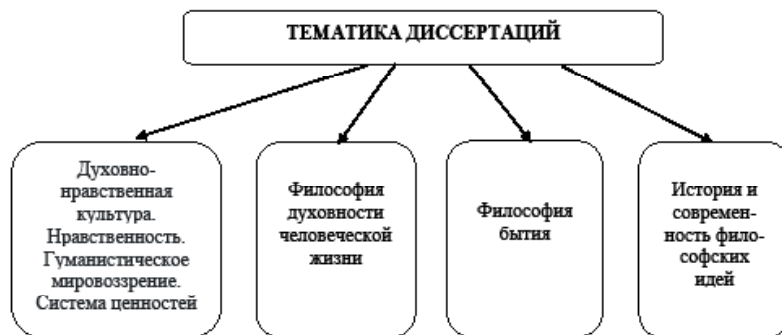
Рис. 3. Классификация диссертационных исследований за период 1994 – 2019 гг. по тематической направленности

В целом для диссертационных работ характерна тенденция, связанная с исследованием вопросов социальной философии. Интерес исследователей привлечён и к историческим аспектам определенных явлений. Далее следуют работы по антропологии.