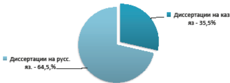
Рис.2. Структура диссертаций по философии по языковому признаку за период 1994 – 2019 гг.

Структура диссертационных работ по языку написания дана на рис. 2., из данных которого следует, что 139 диссертаций (35,5%) было защищено на казахском языке и на русском языке – 252 диссертации (64,5%).