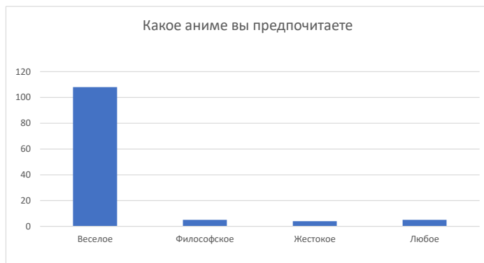
Рисунок 4. – «Какое аниме Вы предпочитаете», в Алматы 2022

Данные опроса свидетельствуют, что современные подростки рассматривают аниме как развлекательную форму досуга. Многие ощущают непонимания взрослых и сверстников и именно поэтому они ищут свои философские ответы на жизни героев в аниме. Для некоторых это целый мир, для других хобби. Кроме того, при проведении социологического опроса установлено, что основными респондентами были подростки мужского пола.