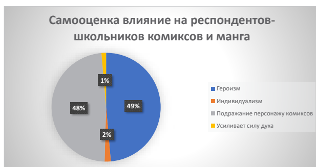
Рисунок 1. - Самооценка влияние на респондентов-школьников комиксов и манга, в Алматы 2022