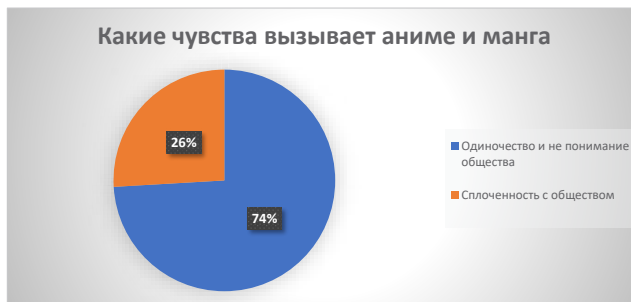
Рисунок 3. – «Какие чувства вызывает, в Алматы 2022 аниме и манга»

На основе этих данных можно констатировать: подростки признаются, что они из-за своего увлечения японской анимацией ощущают непонимание со стороны сверстников. Помимо этого, аниме часто учит дружить со сверстниками и даже показывает, как это нужно делать в обществе любителей анимации.